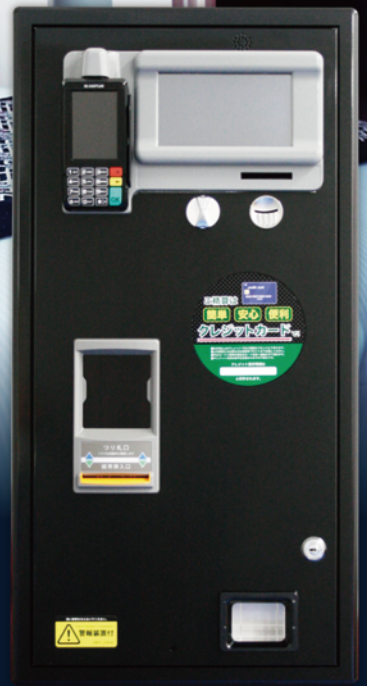
オプション色：ブラックメタリック