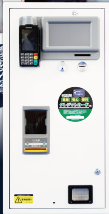
標準色：ホワイトパール